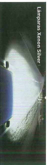
Lámparas Xenon Silver